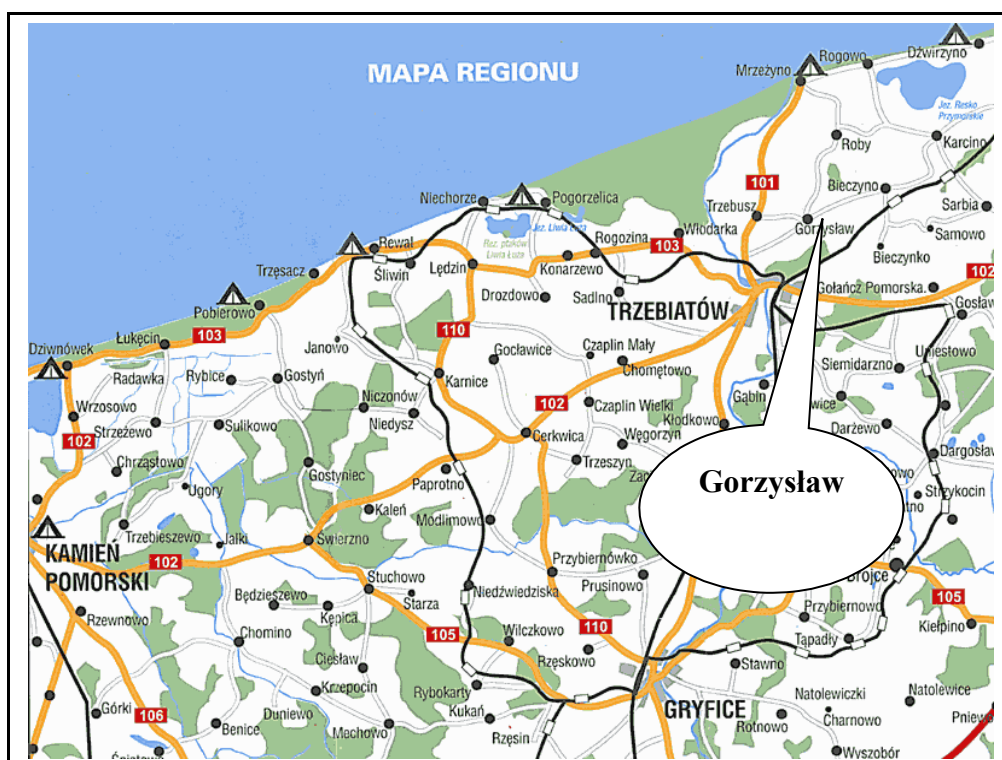
Mapa 2. Otoczenie Sołectwa - gmina Trzebiatów i okolice

powiększenie już istniejącego ładunku i emisji zanieczyszczeń w obręb poziomu użytkowego musi doprowadzić do degradacji jego zasobów wodnych.