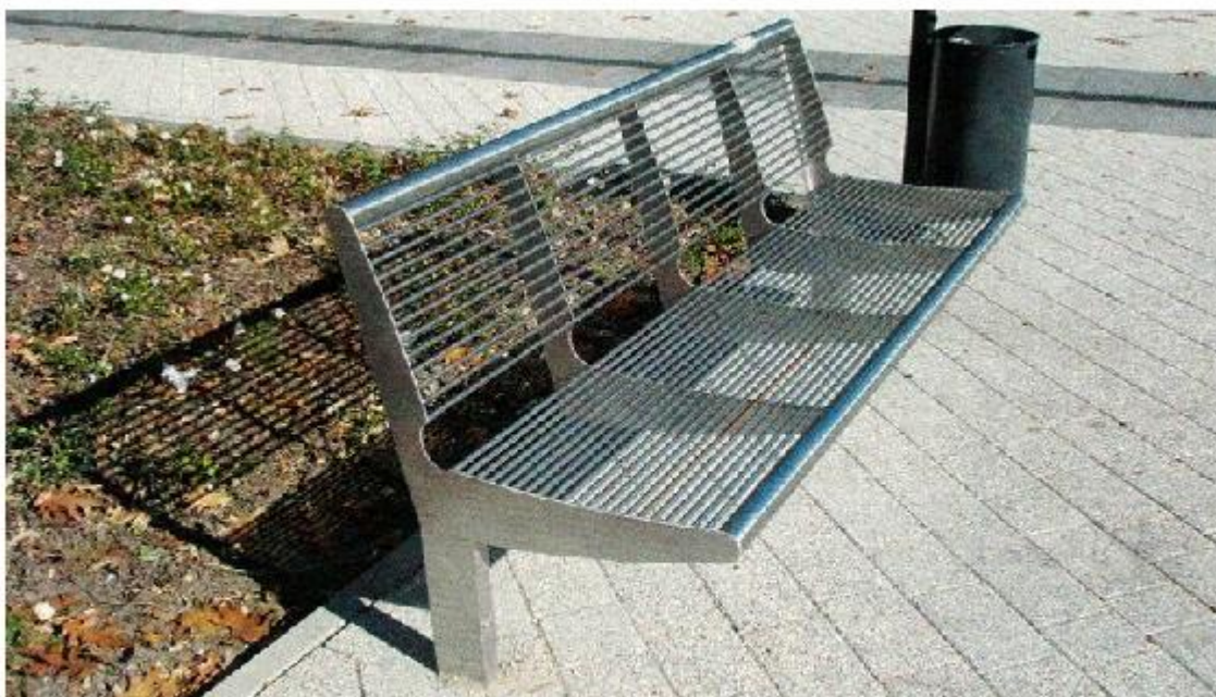
Rys. 1 Przykładowa ławka.