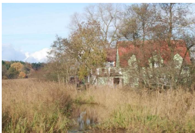
Fot. Widok na Starą Regę po stronie wschodniej wyspy, z dominującą trzciną pospolitą i w sąsiedztwie tereny zabudowane

Po stronie zachodniej wyspy płynie Stara Rega.