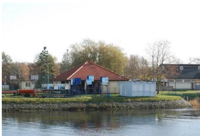
Fot. Poglądowy widok na zainwestowanie terenu po stronie południowej mostu nad rzeką Regą i po stronie wschodniej jej brzegu

W obszarze opracowania i po stronie południowej mostu nad Regą i po stronie wschodniej brzegu, znajduje się zainwestowanie o funkcji rekreacyjno – wypoczynkowej. Brzeg rzeki jest technicznie umocniony i znajduje się tam niewielki basen dla jednostek pływających.