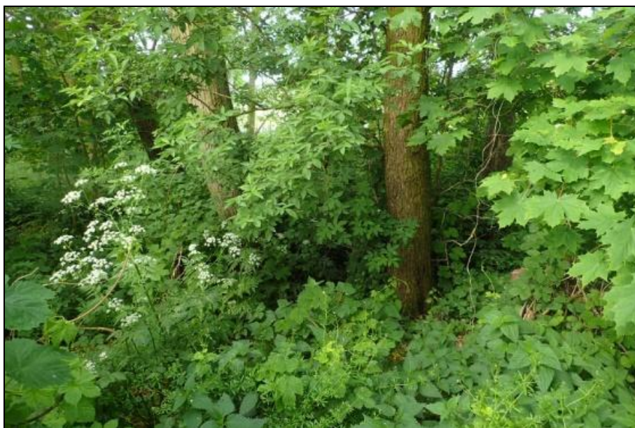
Fot. 8. Siedlisko przyrodnicze 91E0 na prawym brzegu Regi przy Kampingu Portowym.