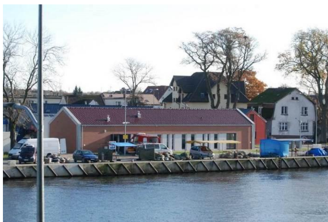
Fot. Poglądowy widok na zainwestowanie terenu portowego po stronie wschodniej brzegu rzeki Regi i w granicach obszaru opracowania

Po stronie wschodniej brzegu i w granicach obszaru opracowania, znajduje się zainwestowanie portu, tj. budynki i pawilony o funkcji usługowo – handlowej, parkingi, ciągi pieszo – jezdne oraz nabrzeże użytkowane przez rybaków.