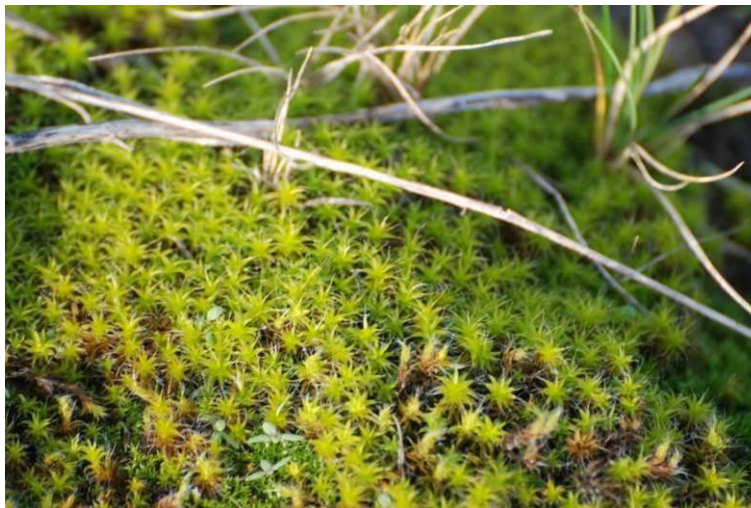
Fot. Mech pędzliczek wiejski Tortula ruralis

Na nieużytkowanych gruntach po stronie wschodniej brzegu rzeki Regi i miejscami, licznie występował nieobjęty ochroną gatunkową mech pędzliczek wiejski - Tortula ruralis . Jest on typowy dla gleb piaszczystych i zaniedbanych gruntów oraz dla terenów ruderalnych.