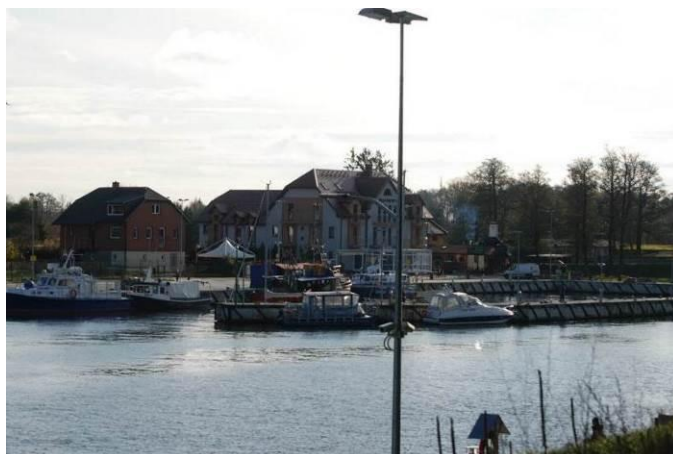
Fot. Poglądowy widok na teren portowy w obszarze opracowania

W obszarze opracowania i po stronie południowej mostu nad Regą i po stronie wschodniej brzegu, znajduje się zainwestowanie o funkcji rekreacyjno – wypoczynkowej. Brzeg rzeki jest technicznie umocniony i znajduje się tam niewielki basen dla jednostek pływających.