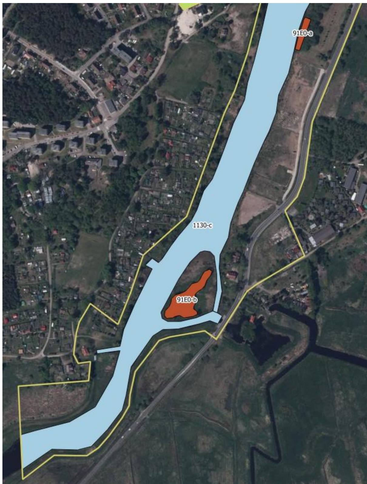
Mapa 2. Wynik inwentaryzacji i waloryzacji siedlisk przyrodniczych w południowej części obszaru.