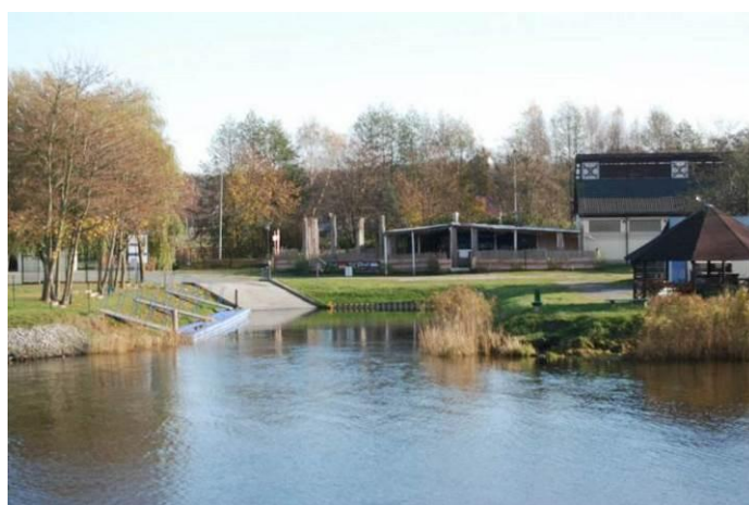
Fot. Widok na basen dla jednostek pływających po stronie południowej mostu nad rzeką Regą