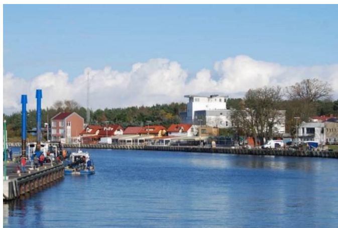
Fot. Widok na teren portowy po stronie północnej mostu nad rzeką Regą

Po stronie północnej mostu, rzeka Rega jest użytkowana przez port morski w Mrzeżynie i brzegi są tam obetonowane, w celu umożliwienia cumowania jednostek pływających.