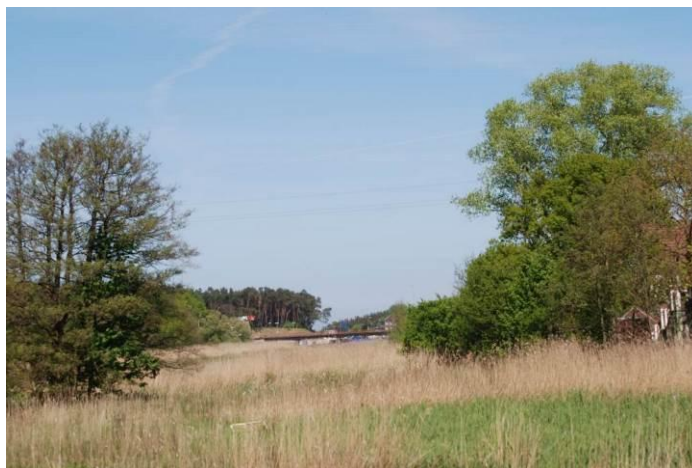
Fot. Widok na szuwar trzcinowy w granicach wyspy

Po stronie zachodniej wyspy płynie Stara Rega.