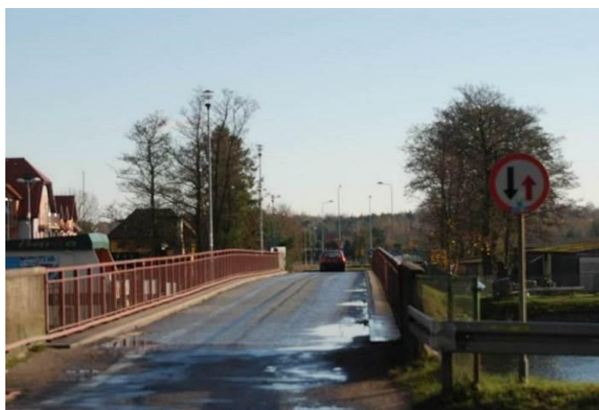
Fot. Most na rzece Redze w ciągu ulicy Wojska Polskiego

Użytkowanie obszaru opracowania zostało pokazane na rysunku ekofizjografii. Obszar ten obejmuje tereny w zachodniej części miejscowości Mrzeżyno. W jego granicach znajduje się ujściowy odcinek rzeki Regi, nad którą i w ciągu ulicy Wojska Polskiego biegnie niezwodzony most.