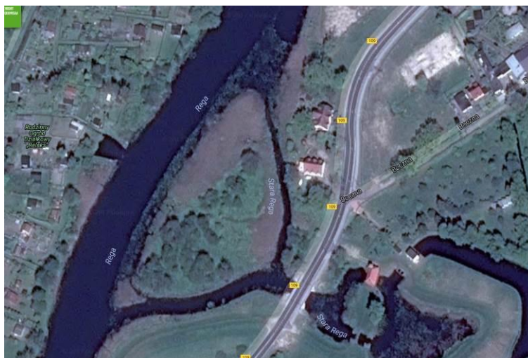
Fot. Widok na wyspę w granicach rzeki Regi, gdzie w planie wyznacza się teren elementarny 20 ZN,UT