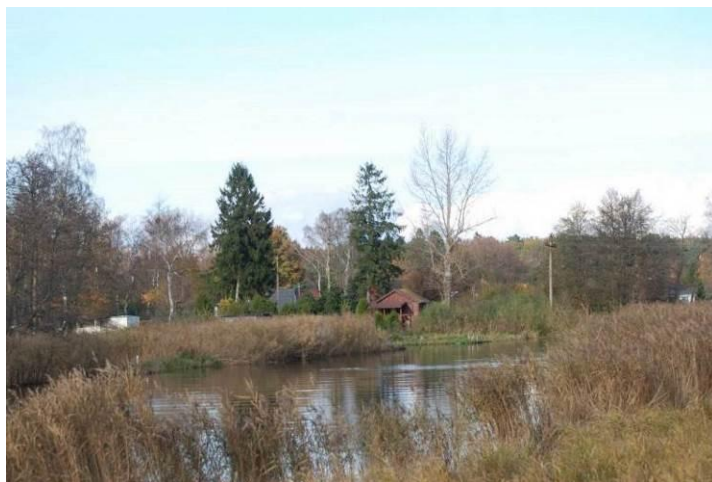
Fot. Poglądowy widok na brzegi rzeki Regi po stronie południowej mostu w ciągu ulicy Wojska Polskiego

Po stronie południowej mostu nad rzeką Regą, jej brzegi są w znacznej części naturalne i głównie porośnięte przez szuwar trzcinowy.