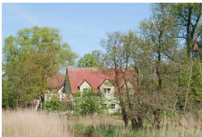
Fot. Widok na budynki mieszkalne w południowej części obszaru planu i w sąsiedztwie brzegu rzeki Regi

W południowej części obszaru planu (teren elementarny 36 MN), znajdują się budynki mieszkalne.