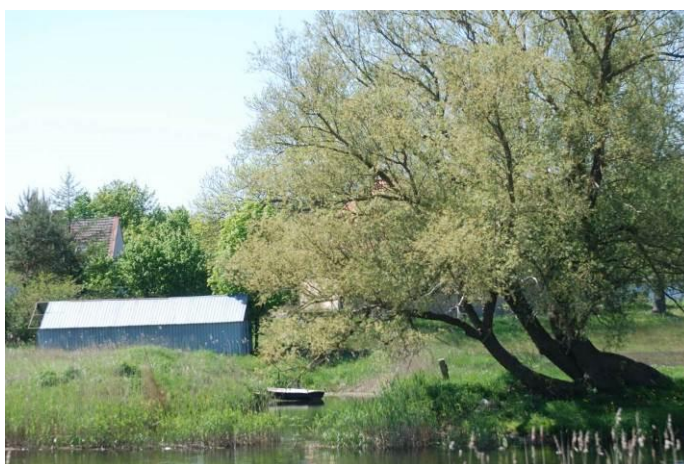
Fot. Poglądowy widok na zachodni brzeg rzeki Regi od strony kompleksu ogrodów działkowych

W planie i dla terenu elementarnego 19 Ws, dopuszcza się realizację kładek pomiędzy terenami 15 TPś, a 20 ZN,UT oraz terenami 20 ZN,UT, a 35a TPś w rejonie oznaczonym na rysunku planu, z uwzględnieniem możliwości przepływu żeglugi śródlądowej dla małych jednostek pomiędzy terenem 15 TPś, a 20 ZN,UT oraz maksymalną ochroną naturalnej strefy przybrzeżnej rzeki.