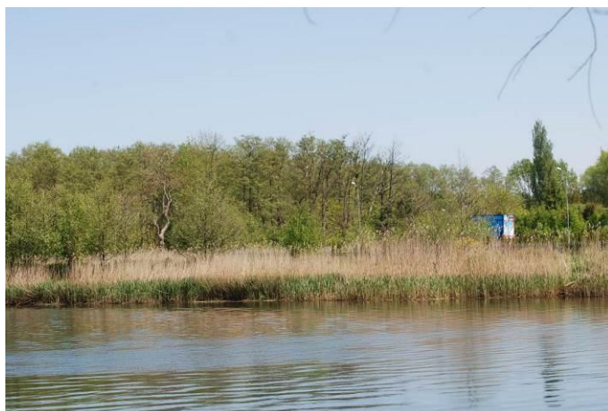
Fot. Poglądowy widok na wschodni brzeg rzeki Regi w obszarze planu

W południowej części obszaru planu (teren elementarny 36 MN), znajdują się budynki mieszkalne.