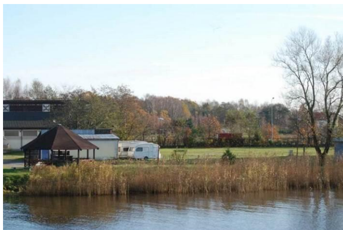
Fot. Widok na teren campingu po stronie południowej mostu nad rzeką Regą i po stronie wschodniej brzegu

Po stronie południowej mostu nad rzeką Regą i po stronie wschodniej brzegu, znajduje się teren użytkowany jako camping.