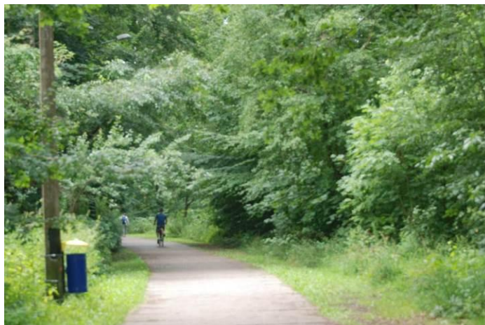
Fot. Widok na istniejący ciąg komunikacyjny

W planie dla tego terenu elementarnego ustala się przeznaczenie: droga wewnętrzna – po śladzie istniejącej drogi leśnej. Wg informacji zamieszczonych na stronie internetowej https://www.bdl.lasy.gov.pl/portal/mapy , teren elementarny 05 KDW jest lasem Nadleśnictwa Gryfice i Leśnictwa Mrzeżyno.