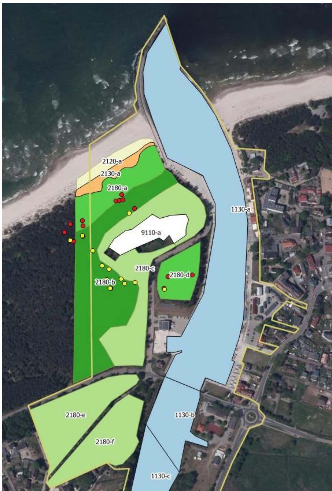
Mapa 1. Wynik inwentaryzacji i waloryzacji siedlisk przyrodniczych w północnej części obszaru. W przypadku siedliska 2180 intensywność koloru zielonego odzwierciedla jego lepszy stan. Punkty wskazują lokalizacje rzadszych gatunków typowych dla siedliska 2180 (czerwone – tajeża jednostronna, żółte – bażyna czarna).