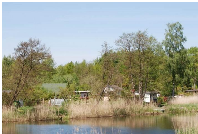
Fot. Poglądowy widok na zachodni brzeg rzeki Regi od strony kompleksu ogrodów działkowych

W tym kompleksie znajdują się ciągi komunikacyjne, z których niektóre biegną do brzegu rzeki Regi. Niektóre części brzegu są przystosowane do cumowania łodzi wiosłowych i tym samym rekreacyjnego użytkowania rzeki. W związku z tym, ewentualne zrealizowanie nowych do 6 pomostów wypoczynkowo – cumowniczych, nie powinno wiązać się z istotnymi presjami na siedlisko przyrodnicze.