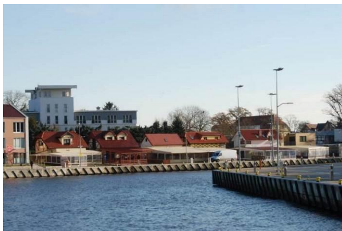
Fot. Poglądowy widok na brzegi rzeki Regi w granicach portu morskiego w Mrzeżynie

Po stronie zachodniej brzegu i w granicach obszaru opracowania, znajduje się parking dla samochodów oraz ciągi pieszo – jezdne.