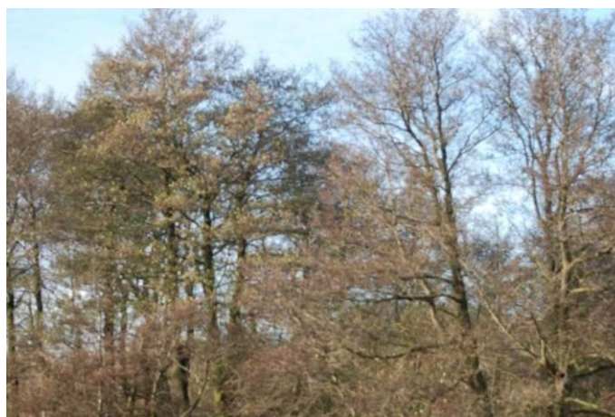
Fot. Widok na olsze czarne rosnące w granicach wyspy

Na wyspie przy rozwidleniu Regi na odcinek ujściowy i Starą Regę, zadrzewienie łęgowe ma charakter zbliżony do naturalnego. Świadczy o tym nieregularny układ przestrzenny płatu, trudnodostępne położenie na wyspie i różnowiekowy drzewostan o zróżnicowanym składzie (olsza czarna z wierzbą białą). Ze względu na położenie płatu na zabagnionej wyspie, w runie duży udział mają gatunki szuwarowe – trzcina pospolita Phragmites australis i turzyca błotna Carex acutiformis .