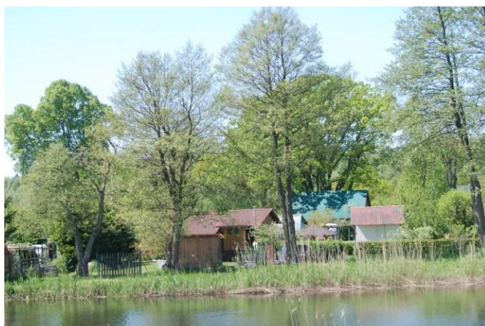
Fot. Poglądowy widok na zachodni brzeg rzeki Regi i ogrody działkowe

Po stronie zachodniej brzegu rzeki Regi i w bezpośrednim sąsiedztwie, znajduje się kompleks ogrodów działkowych. W ich sąsiedztwie, brzeg jest częściowo przekształcony antropogenicznie, co jest związane z rekreacyjnym użytkowaniem rzeki.