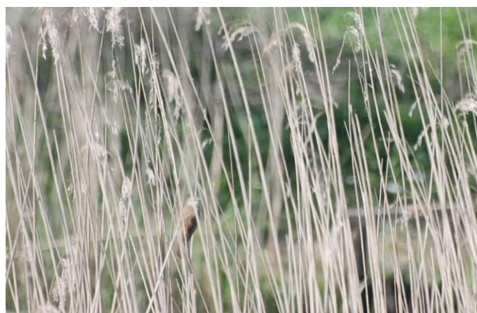
Fot. Trzciniak siedzący w szuwarze trzcinowym przy brzegu rzeki Regi

Przybrzeżny szuwar trzcinowy oraz drzewa i krzewy rosnące przy brzegu, były wykorzystywane siedliskowo przez następujące gatunki ptaków: modraszka Cyanistes caeruleus (ochrona ścisła), trznadel Emberiza citrinella (ochrona ścisła), trzcinia Erpetichthys calabaricus (ochrona ścisła), potrzos Schoeniclus schoeniclus (ochrona ścisła).