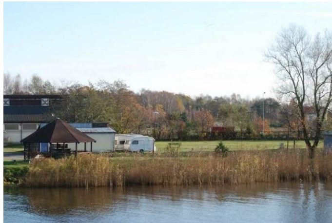
Fot. Widok na teren campingu po stronie południowej mostu nad rzeką Regą i po stronie wschodniej brzegu

Po stronie południowej mostu nad rzeką Regą i po stronie wschodniej brzegu, znajduje się teren użytkowany jako camping.