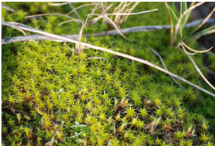
Fot. Mech pędzliczek wiejski Tortula ruralis

Na nieużytkowanych gruntach po stronie wschodniej brzegu rzeki Regi i miejscami, licznie występował nieobjęty ochroną gatunkową mech pędzliczek wiejski - Tortula ruralis . Jest on typowy dla gleb piaszczystych i zaniedbanych gruntów oraz dla terenów ruderalnych.