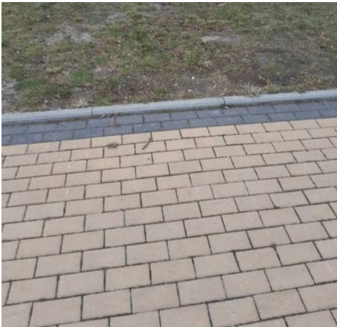
Zdjęcie nr 1: Istniejący chodnik przylegający do działki, na której zlokalizowany będzie szalek publiczny objęty zamówieniem.